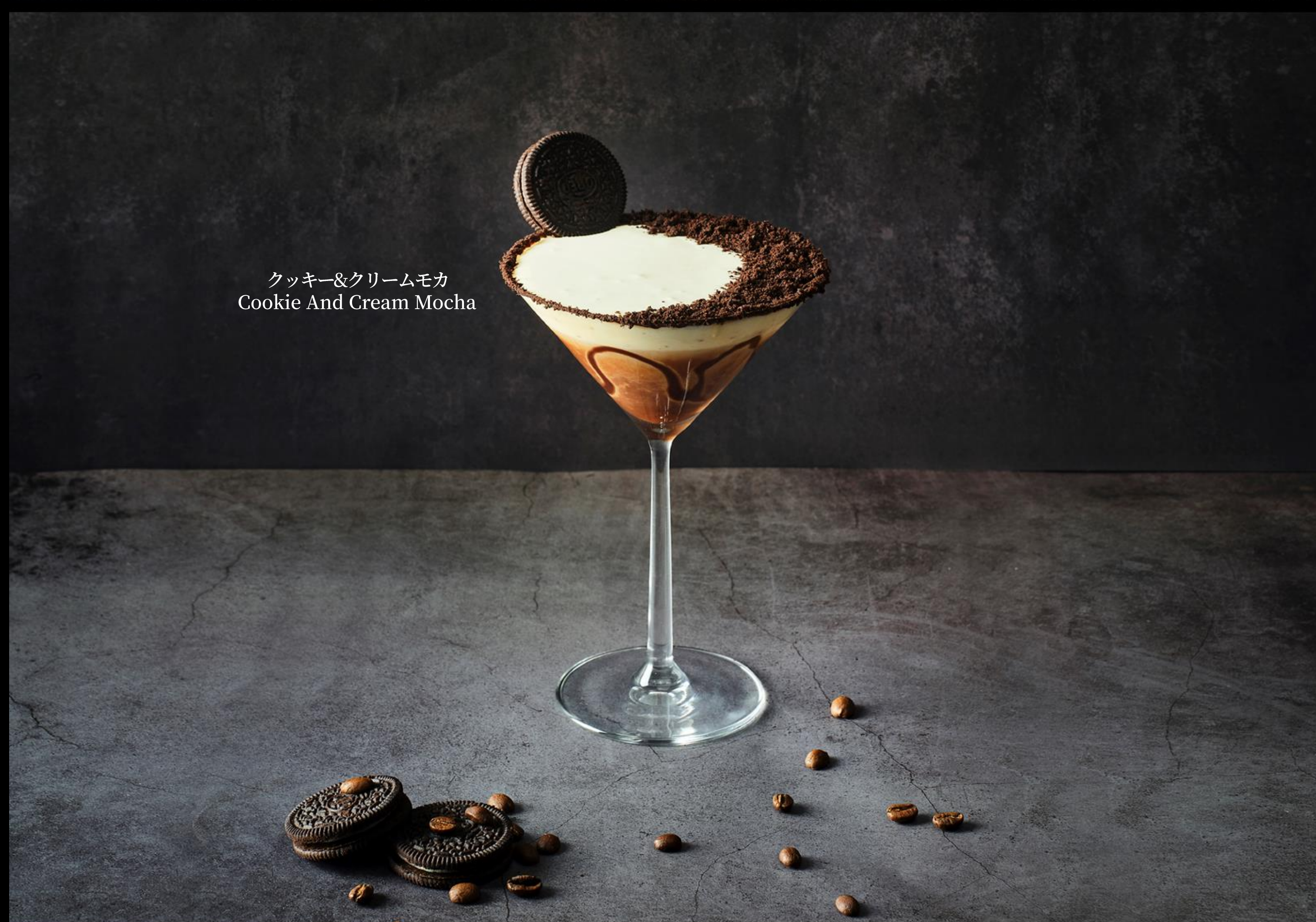
クッキー&クリームモカ Cookie And Cream Mocha