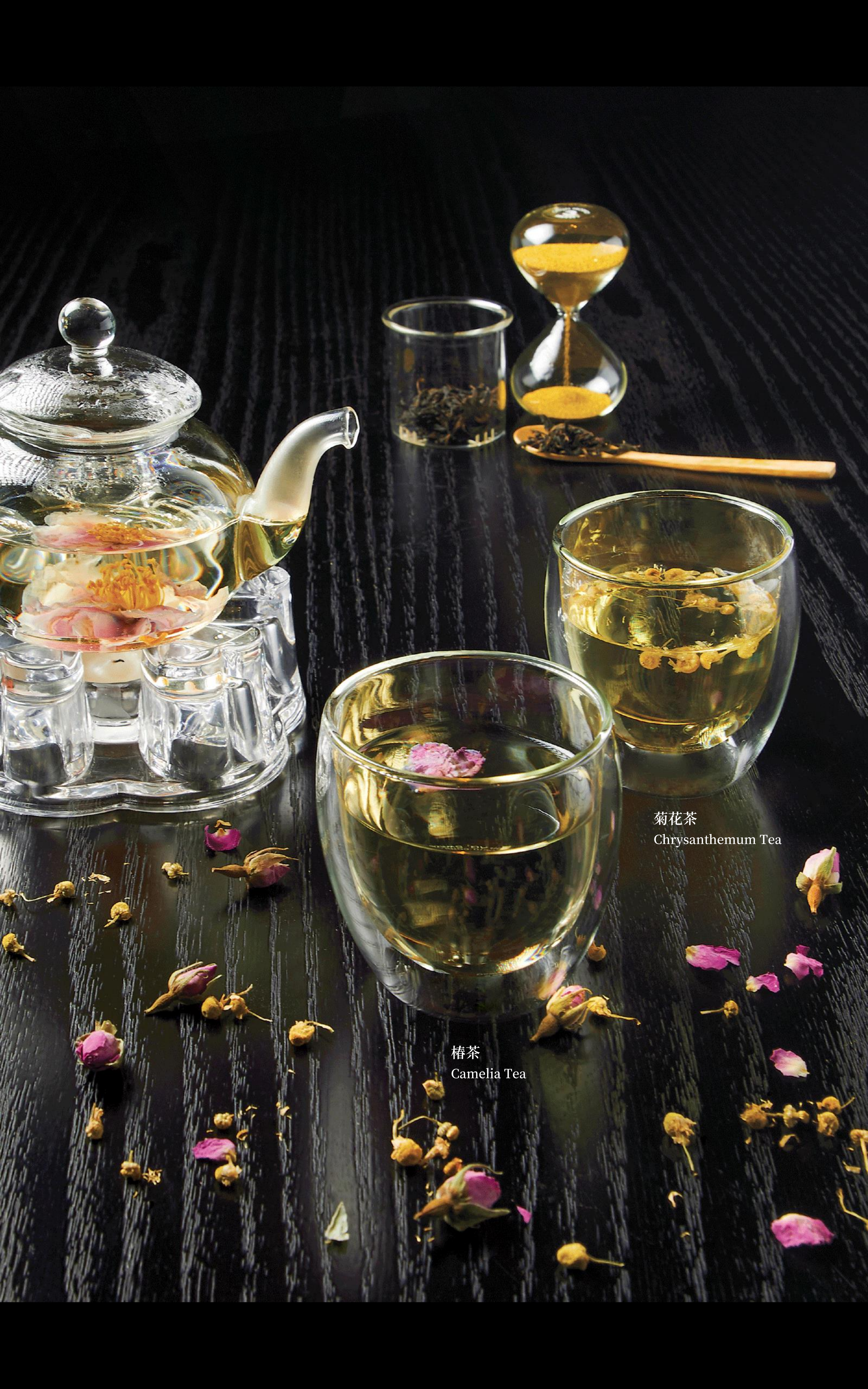
菊花茶 Chrysanthemum Tea