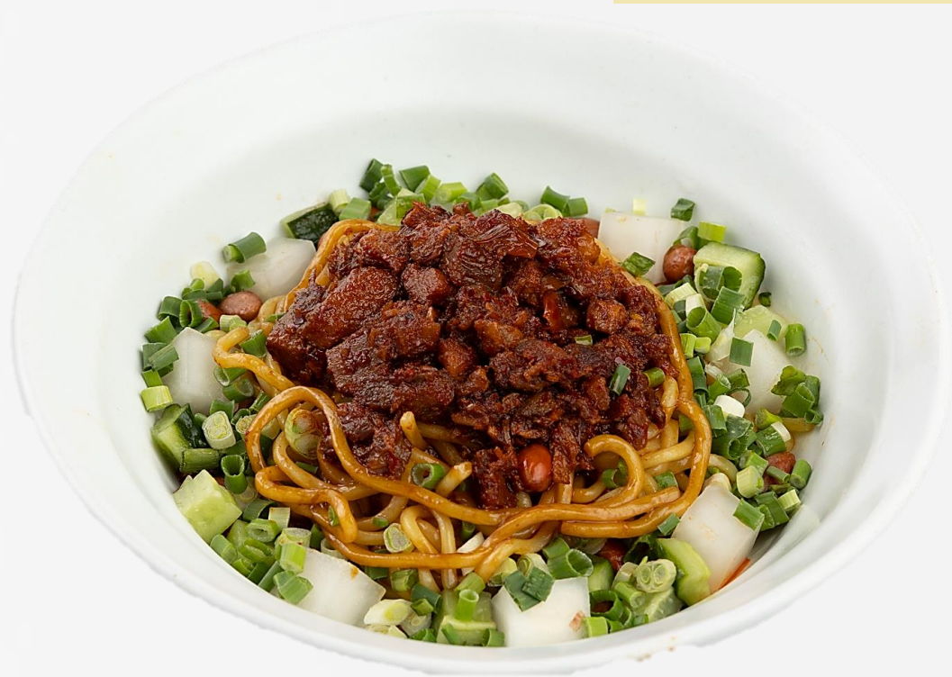
肉末热干面 Spicy minced pork tossed noodle 매운 다진 돼지고기 열간면 프리辛豚ミンチ入り和え麺 18