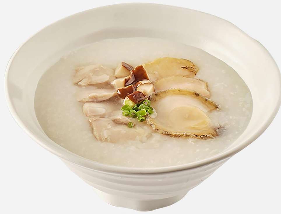
鲜鲍鸡肉粥 Abalone and chicken congee 전복 닭고기 죽 (전복:국내산, 닭고기:국내산, 쌀:국내산) アワビと鶏肉のお粥