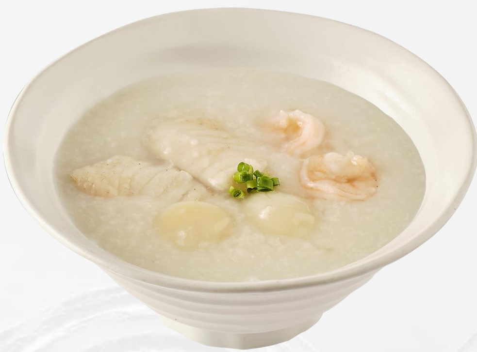
状元海鲜粥 Sliced fish and scallops congee 생선 관자 죽 (쌀:국내산) ホタテ貝柱と魚のお粥