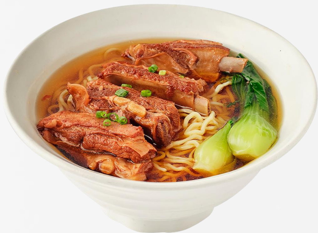
红焖羊排汤面 Braised mutton noodle soup 양갈비 탕면 (양고기:호주산) 羊肉の煮込み麺