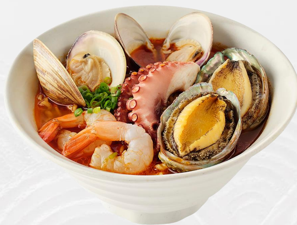
海鲜拉面 Seafood Ramen 제주 해산물 라면 韓国風チャンポン