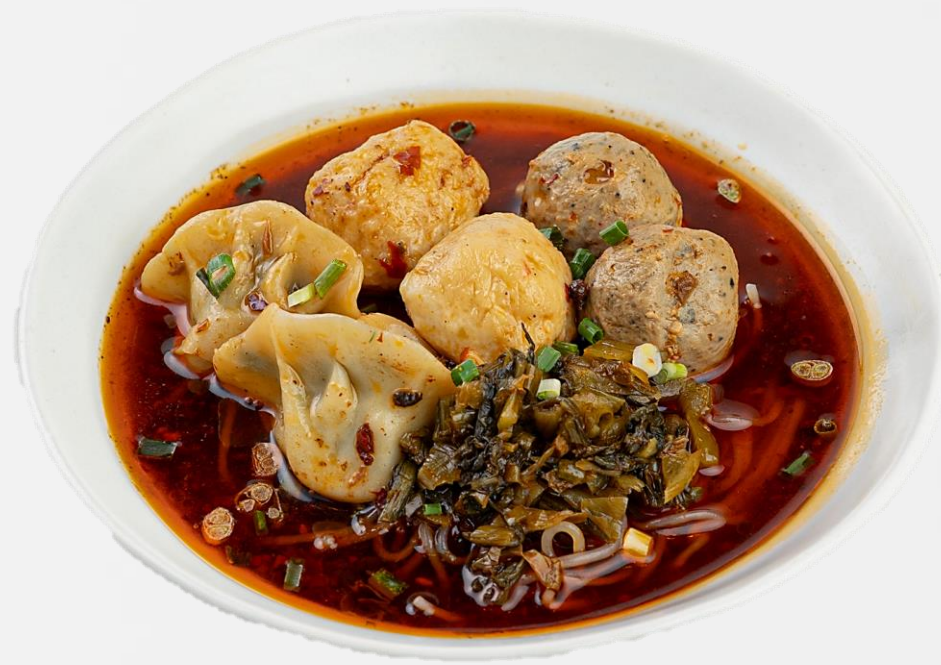
酸辣三宝米线 Sichuan spicy balls vermicelli soup 짬라 믹스볼 쌀국수 四川風春雨スープ 18