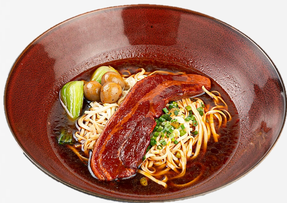
腩排卤肉面 Pork belly steak noodle soup 갈비살 튀김 탕면 豚バラステーキ入り麺 18