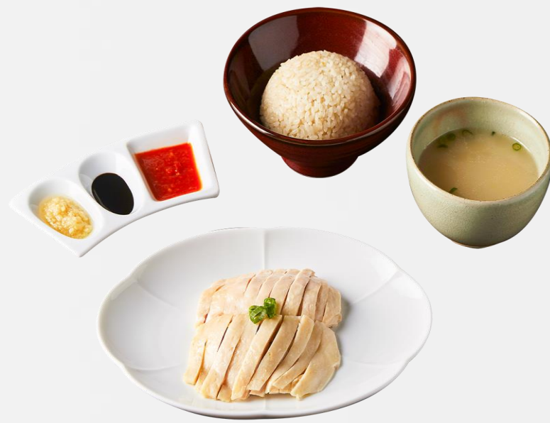
海南鸡饭 Hainan chicken rice 하이난 치킨 라이스 (닭고기:국내산, 쌀:국내산) 海南チキンライス