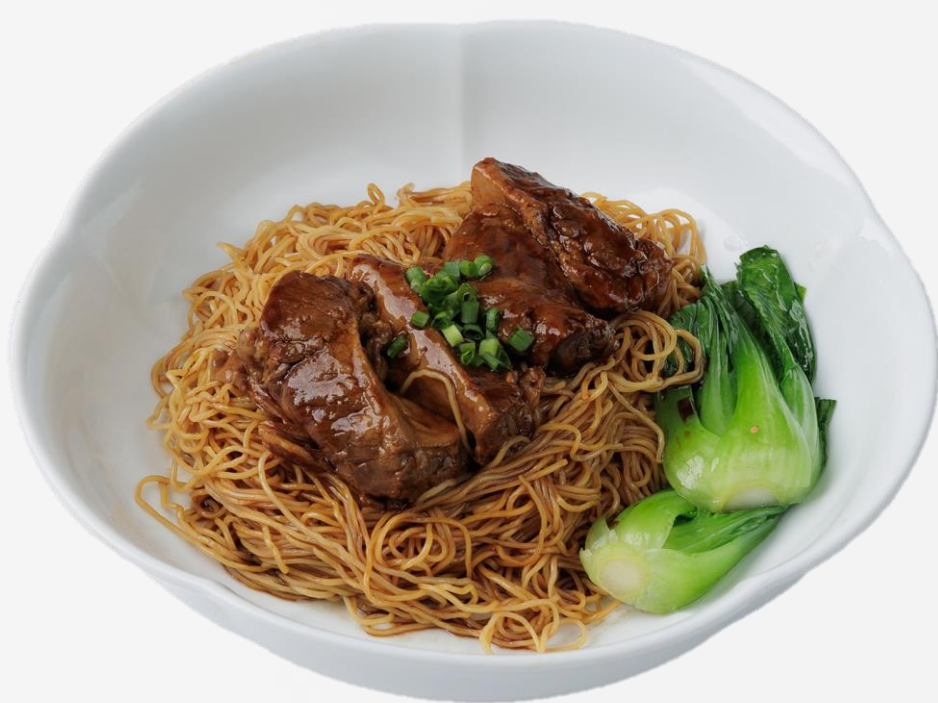
牛腩捞面 Beef brisket, tossed noodle 차돌박이 볶음면 (소고기:미국산) 牛스지肉入り焼きそば 18