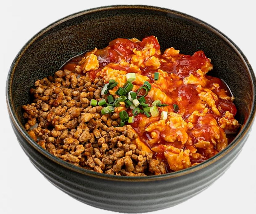
番茄鸡蛋卤肉末刀削面 Hand shaved noodle with egg tomato and minced pork 토마토 계란 산시식 도삭면 山西風 卵とトマト入り刀削麺 18