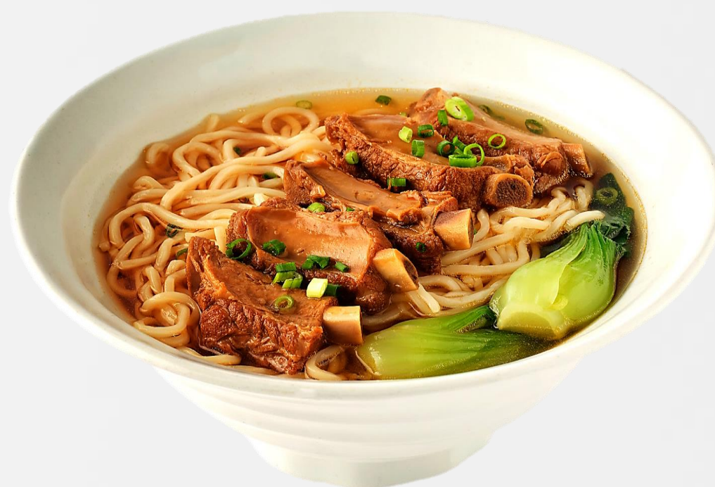
红烧排骨面 Braised pork ribs noodle soup 등갈비조림 탕면 (돼지고기:스페인산) 스파리브의煮込み麺