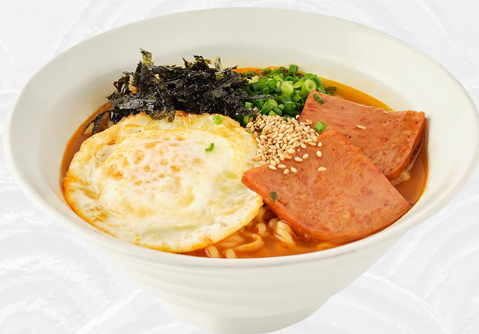
餐肉蛋辛辣面 Instant noodle with spam and egg 계란후라이와 스팸을 곁들인 신라면 (돼지고기:미국, 스페인, 캐나다 등) 인스턴트麵의 스팸과 卵添え 15

모든 가격은 원화이며 천원 단위로 표기됩니다. 10% 부가세와 10% 봉사료가 포함되어 있습니다. 価格はすべて千ウォン(KRW)単位で表記されており、10%の付加価値税と10%のサービス料が含まれています。