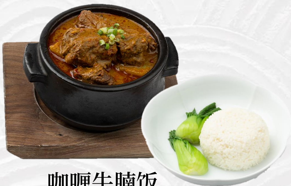
咖喱牛腩饭 Curry beef brisket rice 차돌박이 카레 (소고기:미국산, 쌀:국내산) 牛バラ肉のカレー