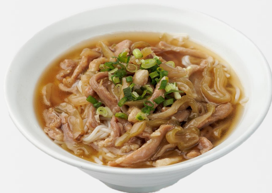
榨菜肉丝汤米 Shredded pork pickled vegetable vermicelli Soup 돼지고기 쌀국수 (돼지고기:국내산) 豚肉入り春雨のスープ 16