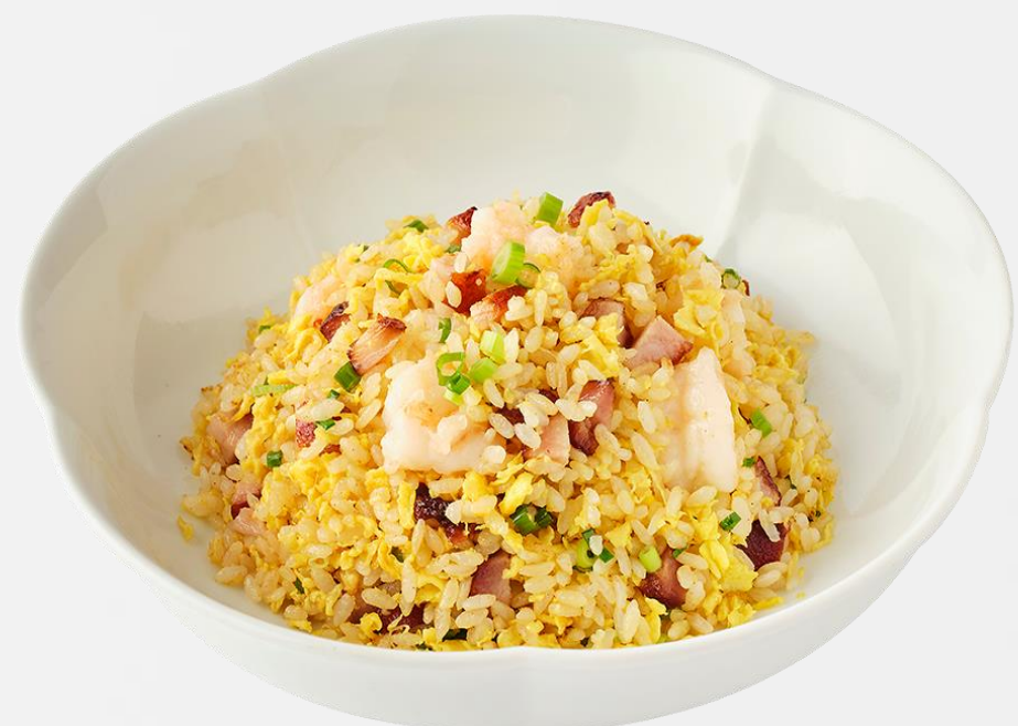
扬州炒饭 Yangzhou fried rice 양저우식 볶음밥 (돼지고기:국내산, 쌀:국내산) 揚州チャーハン