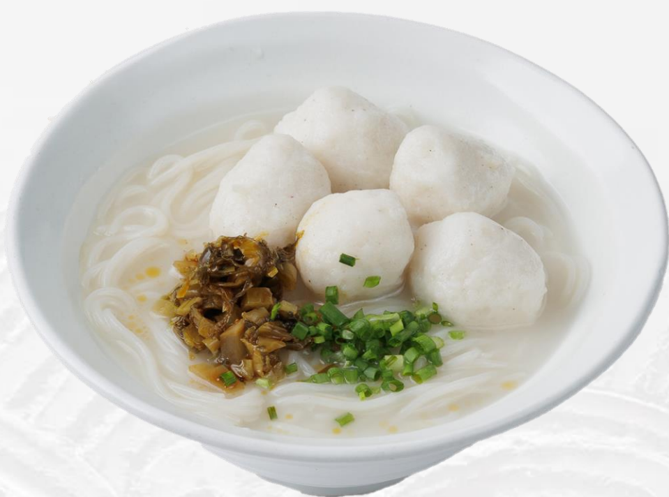
酸菜墨鱼丸米线 Cuttlefish balls vermicelli with sauerkraut 갯오징어 완자 쌀국수 イカ団子入り春雨スープ