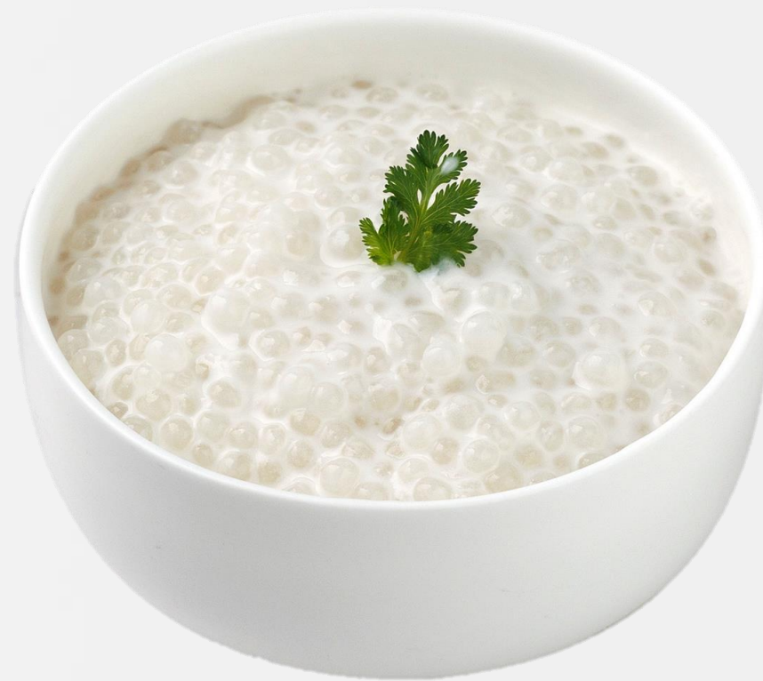
冻椰汁西米露 Chilled coconut sago 코코넛 사고 코코나쯔사고