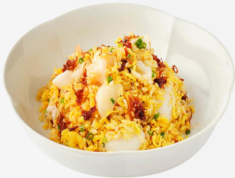
X.O 醬海鮮炒飯 Seafood fried rice with X.O. sauce X.O. 해산물 볶음밥 (쌀:국내산) シーフードとXO醬の炒飯