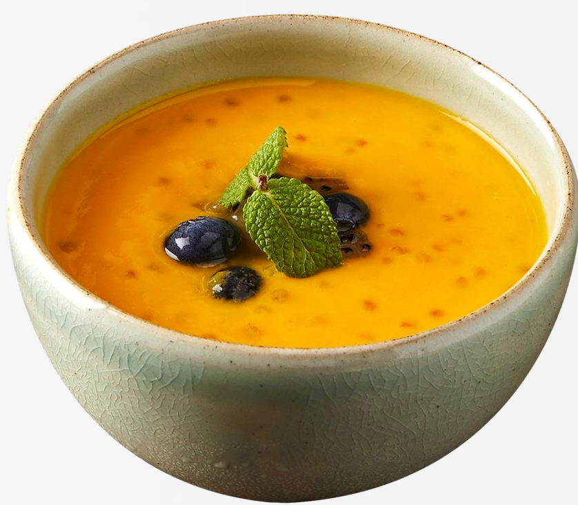
冻杨枝甘露 Chilled mango pomelo sago 망고 포멜로 사고 マンゴーポメロサゴ