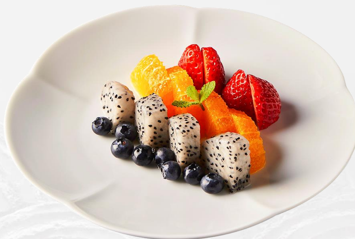
时令水果盘 Fresh fruit platter 과일 플래터 新鮮なフルーツの盛り合わせ