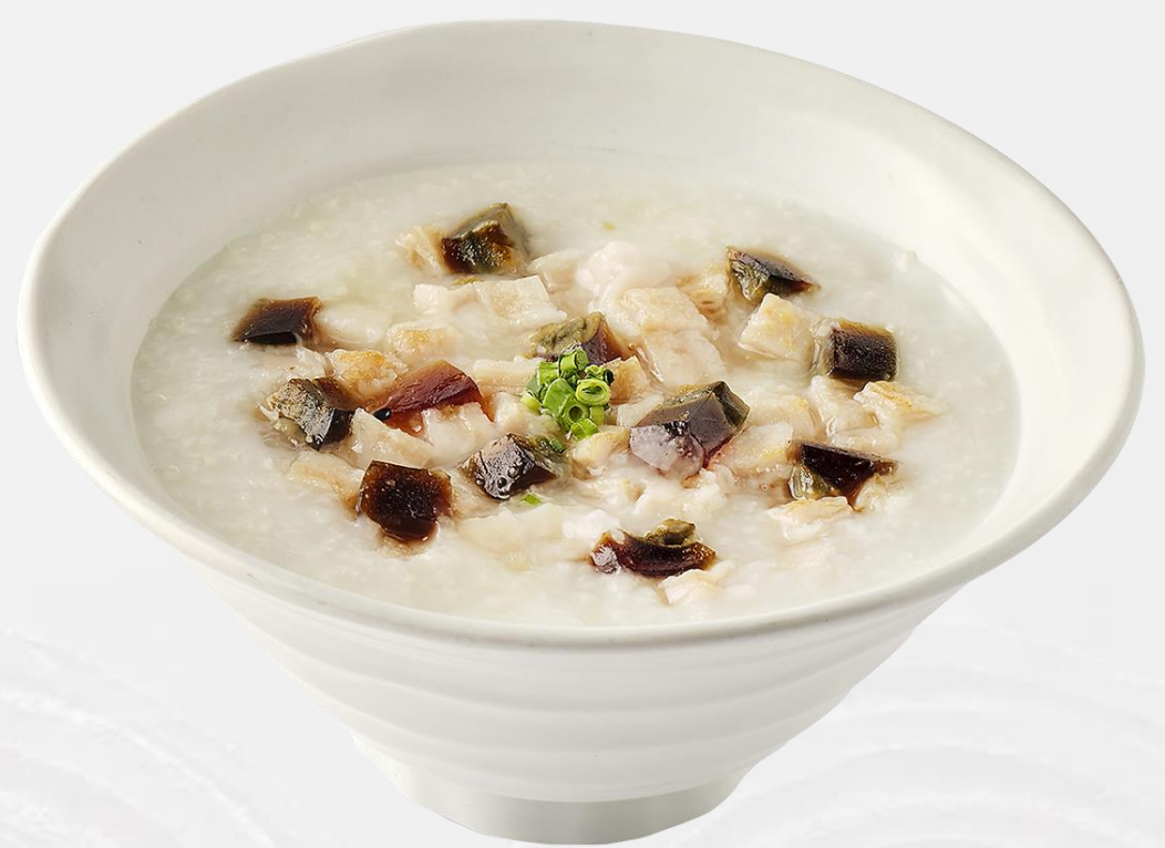
皮蛋咸肉粥 Pork and century egg congee 송화단 돼지고기 죽 (돼지고기:국내산, 쌀:국내산) ピータンと豚肉のお粥