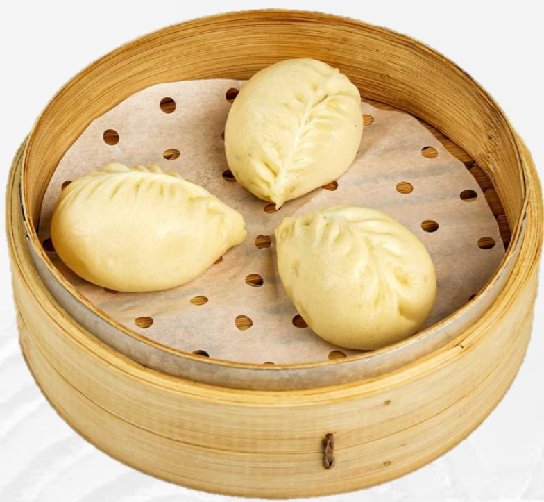
猪肉包子 (3件) Steamed pork bun (3 pieces) 돼지고기 왕만두 (돼지고기:칠레산) 豚まん (3個)