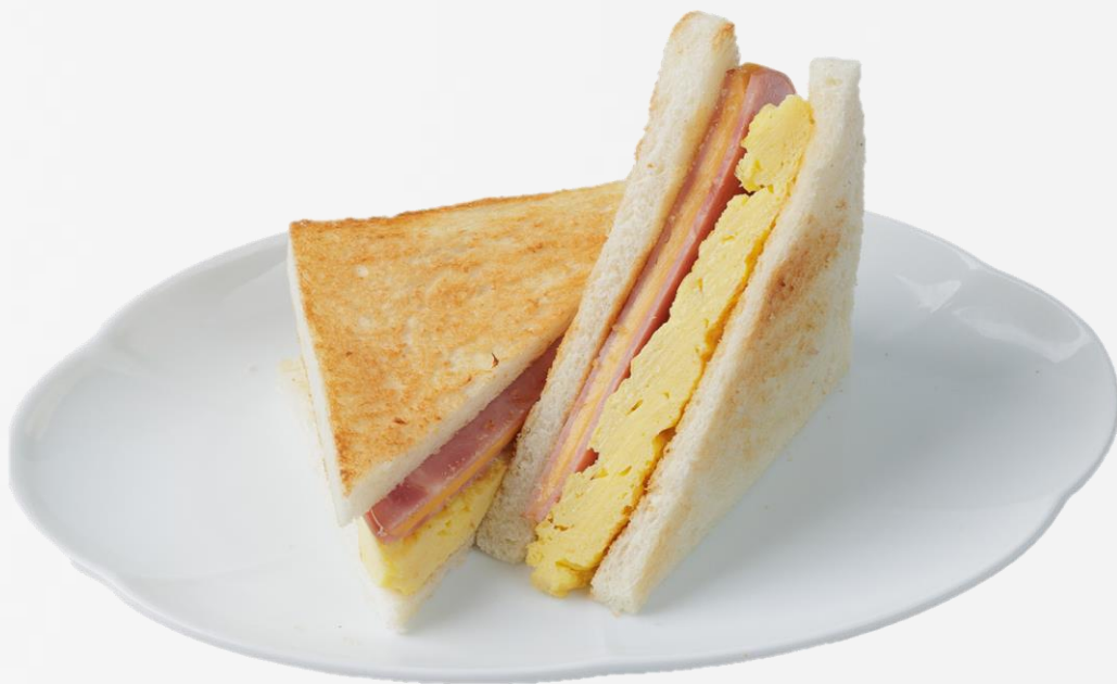
午餐肉鸡蛋三明治