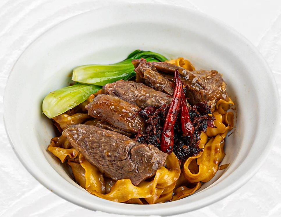
X.O 醬牛面腩拌面 Beef cheek tossed noodle with X.O sauce X.O소스 소불살 비빔면 X.Oソース牛肉入り焼きそば 18