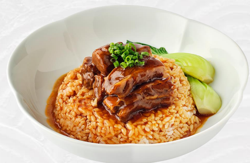
红焖牛腩饭 Braised beef brisket rice 차돌박이찜 덮밥 (소고기:미국산, 쌀:국내산) 牛バラ肉ご飯