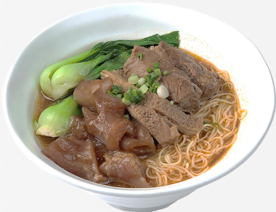
绝味牛筋腩汤面 Braised beef brisket and tendon noodles soup 양지머리 스키 탕면 (소고기:미국산) 牛スジと腱の煮込みスープ 20