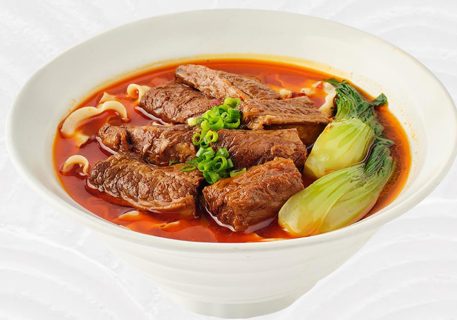
红烧牛腩汤面 Taiwanese beef noodle soup 대만식 우육탕면 (소고기:미국산) 台湾風牛肉麵 18

모든 가격은 원화이며 천원 단위로 표기됩니다. 10% 부가세와 10% 봉사료가 포함되어 있습니다. 価格はすべて千ウォン(KRW)単位で表記されており、10%の付加価値税と10%のサービス料が含まれています。