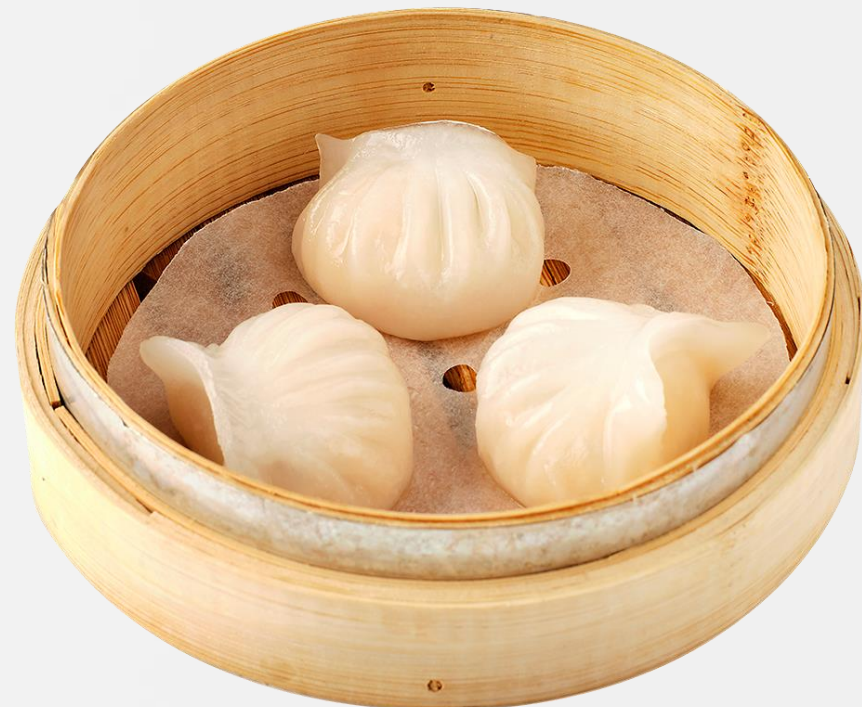
笋尖鲜虾饺 (3件) Shrimp with bamboo shoots 새우 딤섬 (3개) 海老蒸し餃子 (3個)