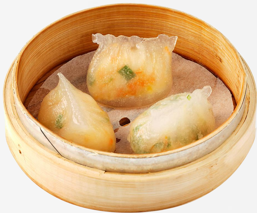
鲜虾韭菜饺 (3件) Pork and mushroom 새우부추 만두 (3개) 海老ニラ餃子 (3個)