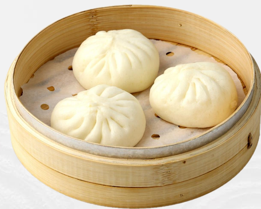
蜜汁叉烧包 (3件) Steamed barbecued pork buns (3 pieces) 차슈 번 (3개) (돼지고기:국내산) チャーシュー肉まん (3個)