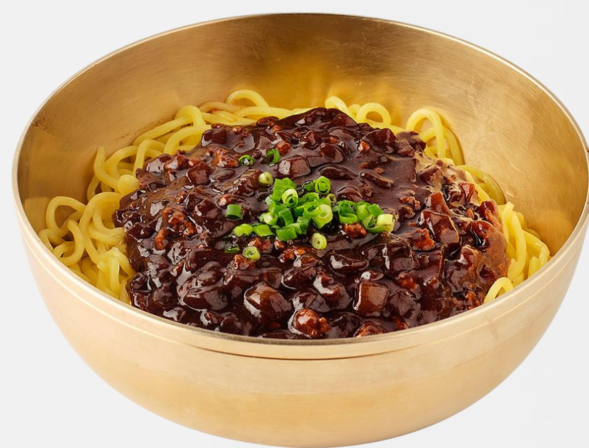
炸酱面 Noodle with black bean paste 자장면 (돼지고기:칠레산) 豆豉醬麵 15