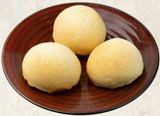
바삭한 돼지고기 번 (돼지고기:국내산) Baked crispy barbecued pork buns 14