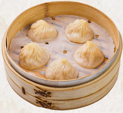
돼지고기 소룡포 (돼지고기:국내산) Steamed Shanghainese pork dumpling 26