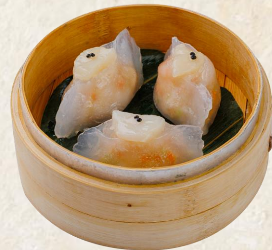
새우 관자 딤섬 Steamed scallop, shrimp 10