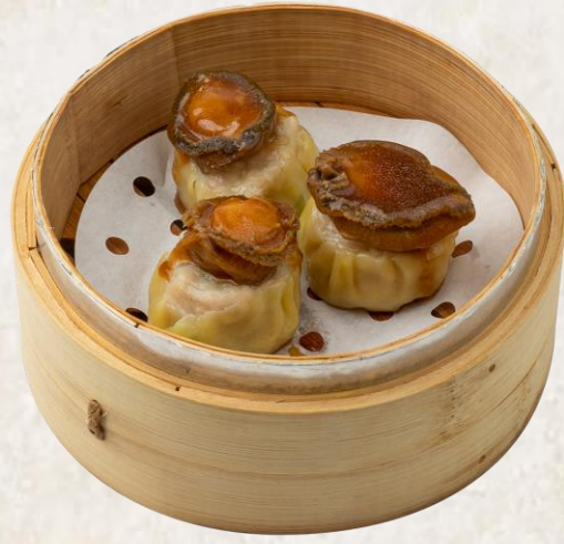
전복 쇼마이 (전복:국내산) Steamed abalone Siu Mai 14