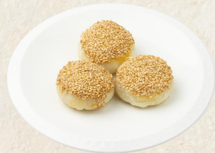
돼지고기 샤오빙 (돼지고기:국내산) Baked minced pork flaky pastry 12