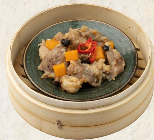
단호박 돼지갈비 찜 (돼지고기:국내산) Steamed pork rib, pumpkin, bean sauce 13

모든 가격은 원화이며 천원 단위로 표기됩니다. 10% 부가세와 10% 봉사료가 포함되어 있습니다.