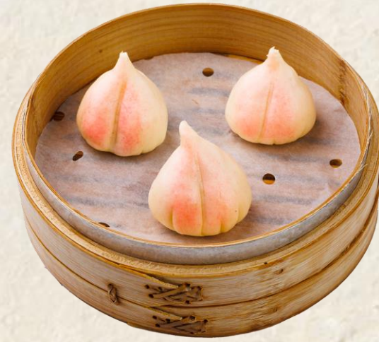
복숭아 찐빵 Steamed birthday bun 12