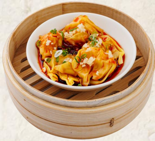
고추기름 새우 딤섬 (돼지고기:국내산) Steamed shrimp, chili oil 12