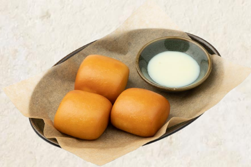
튀긴 꽃빵 Deep fried bun 8

모든 가격은 원화이며 천원 단위로 표기됩니다. 10% 부가세와 10% 봉사료가 포함되어 있습니다.