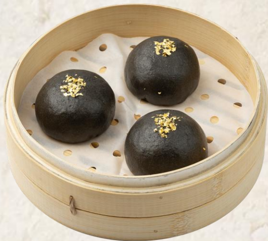
커스터드 번 Salted egg yolk custard bun 12