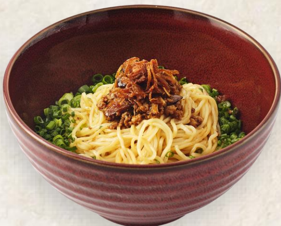
파기름 돼지고기 비빔면 (돼지고기:국내산과 덴마크산 섞음) Dried noodles with spring onion oil, minced pork and mushroom 19