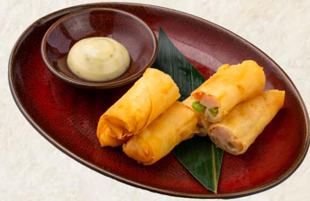
새우 춘권 Deep fried shrimp spring roll 14