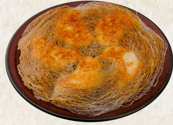
돼지고기 새우 군만두 (돼지고기: 국내산과 덴마크산 섞음) Pan fried pork and shrimp dumpling 18