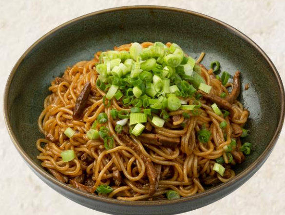
오리고기 볶음면 (오리고기: 국내산) Fried noodles with shredded duck and vegetables 18