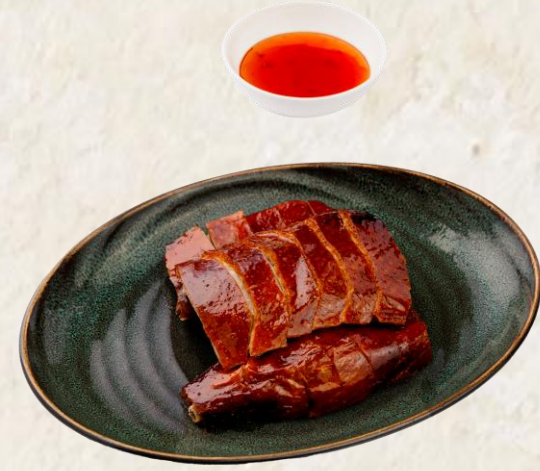
광동식 구운 오리 (오리고기:국내산) Cantonese roasted duck 22