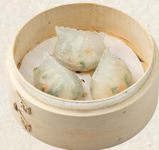
새우 부추 딤섬 Steamed shrimp dumplings, chives 9