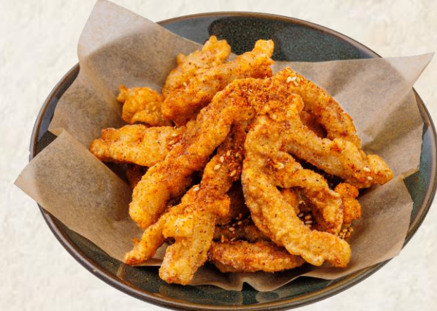
매콤한 돼지고기 튀김 (돼지고기:칠레산) Deep fried pork neck, spiced chili pepper 18