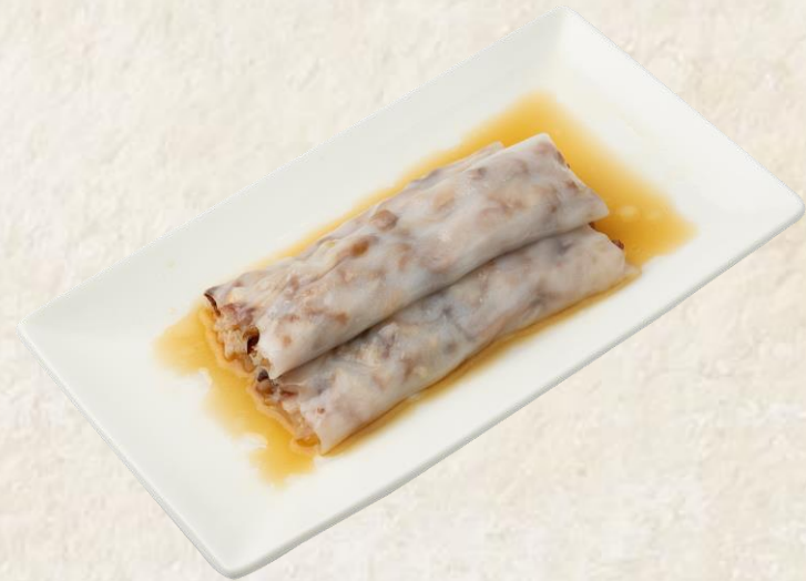
돼지고기 창편 (쌀:태국산, 돼지고기: 국내산) Steamed barbecued pork rice roll 20