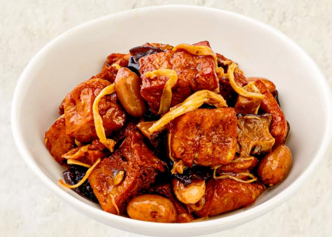
글루텐 냉채 Shanghainese braised 'Kao Fu' 14

모든 가격은 원화이며 천원 단위로 표기됩니다. 10% 부가세와 10% 봉사료가 포함되어 있습니다. Prices are in Korean Won at 1,000 value and include 10% tax and 10% service charge