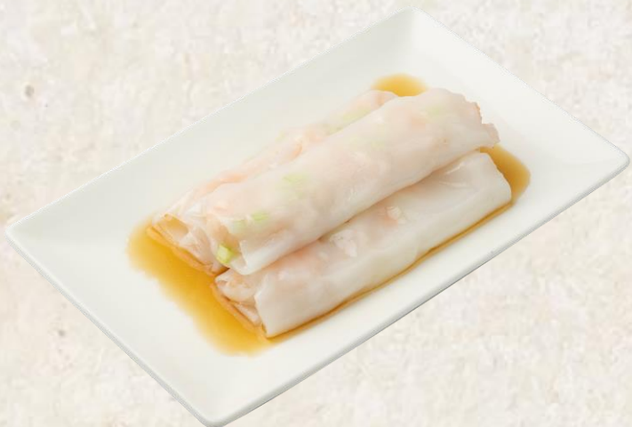
새우 창편(쌀:태국산) Steamed prawn rice roll 19