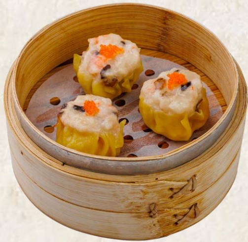
돼지고기 쇼마이 (돼지고기:칠레산과 국내산 섞음) Steamed pork, shrimp Siu Mai 12