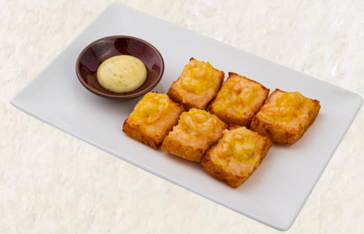
멘보샤 Deep fried shrimp toast, mayonnaise 13