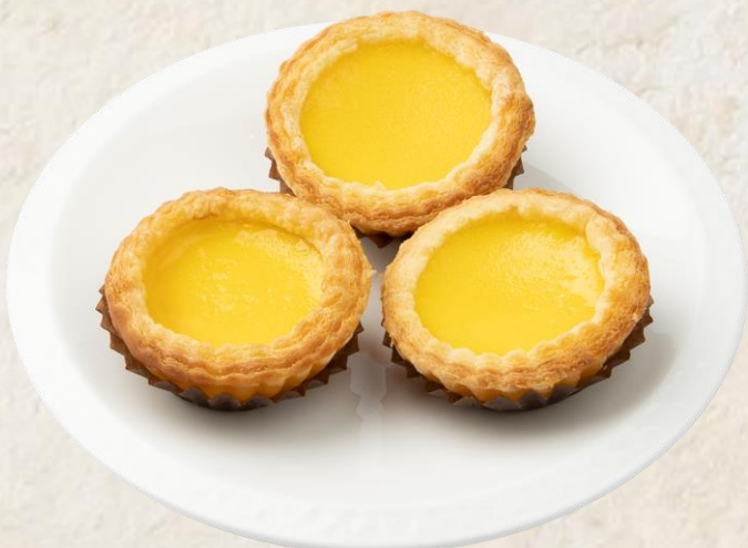
에그 타르트 Egg tart 12