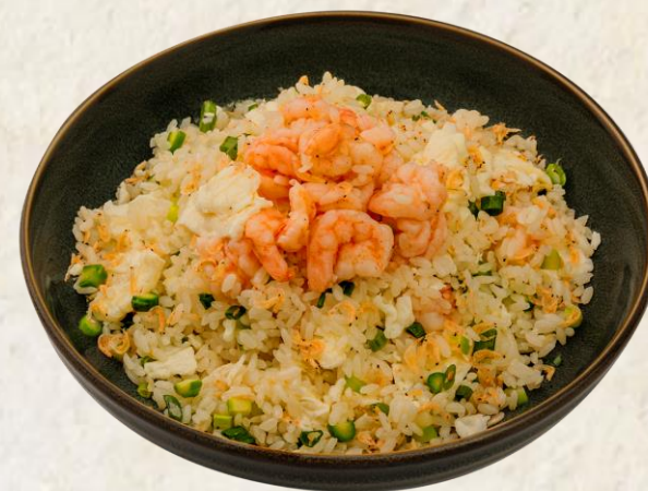
새우 관자 볶음밥 Fried rice with sakura shrimp, crab meat, egg white and vegetables 28

모든 가격은 원화이며 천원 단위로 표기됩니다. 10% 부가세와 10% 봉사료가 포함되어 있습니다. Prices are in Korean Won at 1,000 value and include 10% tax and 10% service charge