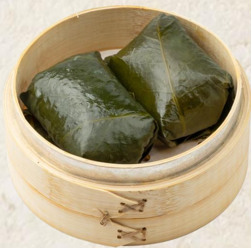
연잎 찹쌀밥 (닭고기, 찹쌀:국내산) Steamed glutinous rice, chicken in lotus leaf 14