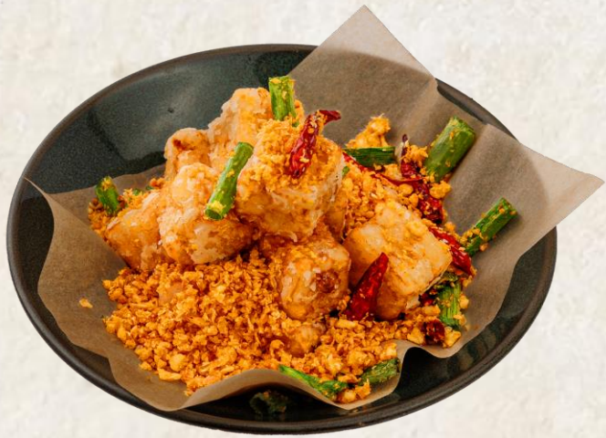
순무 케이크 Deep fried turnip cake 12