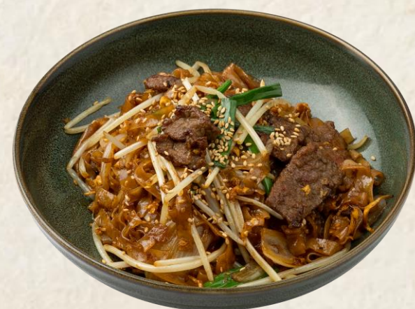
소고기 볶음면 (소고기:미국산) Stir fried flat rice noodles with beef slices 21