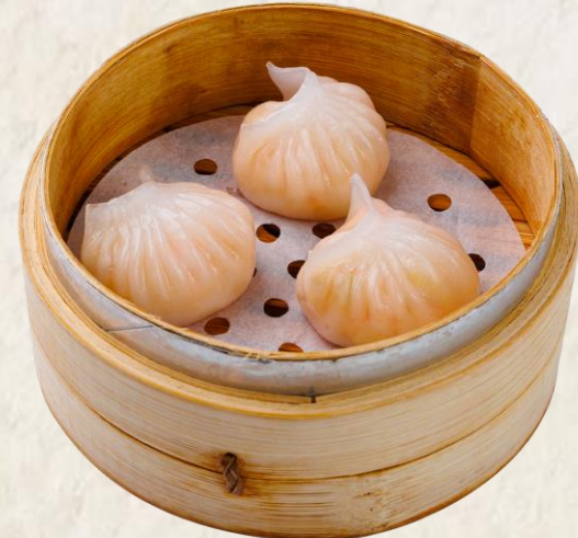
새우 죽순 하가우 (돼지고기:국내산) Steamed shrimp, bamboo shoot 10