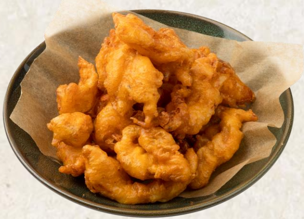
매콤한 오징어 튀김(한치:국내산) Deep fried squid with spicy sauce 20