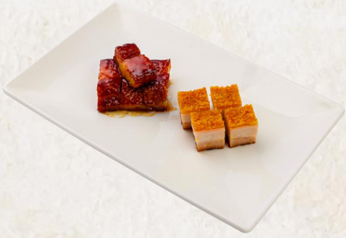
바삭한 삼겹살 구이와 광동식 흑돼지 바비큐 (돼지고기:국내산) Crispy pork belly, honey barbecue pork 28