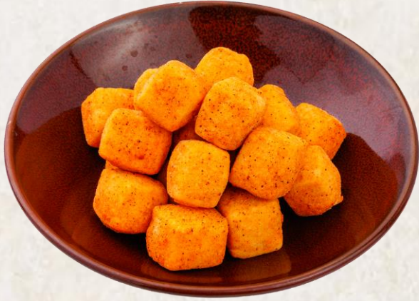
두부 튀김 (두부·콩:국내산) Deep fried bean curd, salt and pepper 12