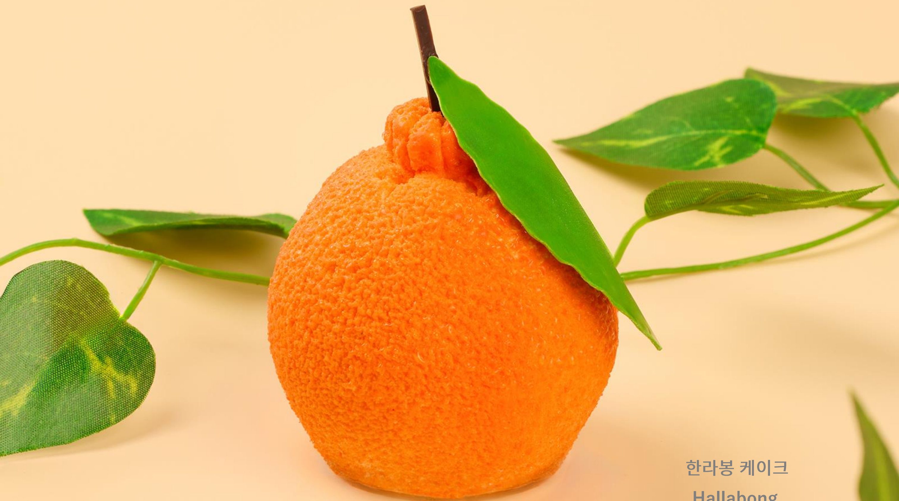
한라봉 케이크 Hallabong