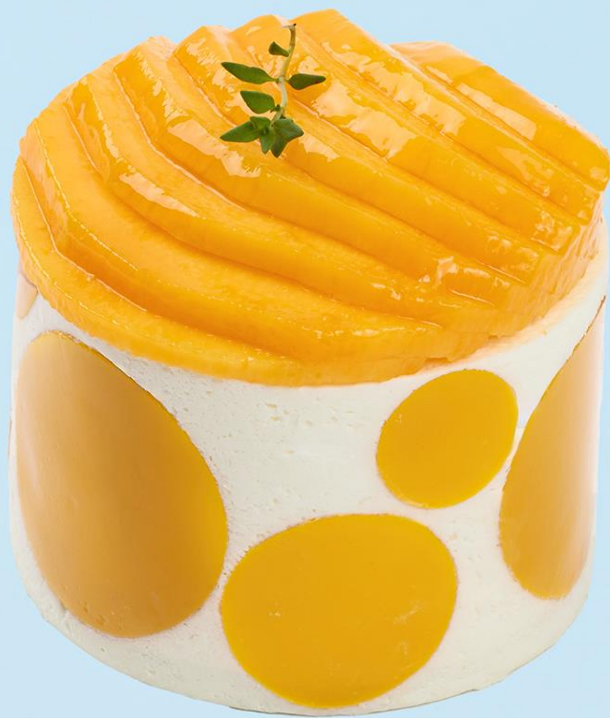
프리미엄 애플 망고 쇼트케이크 Premium Apple Mango Shortcake