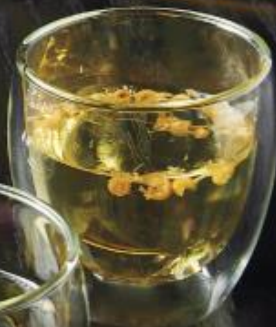
국화차 Chrysanthemum Tea