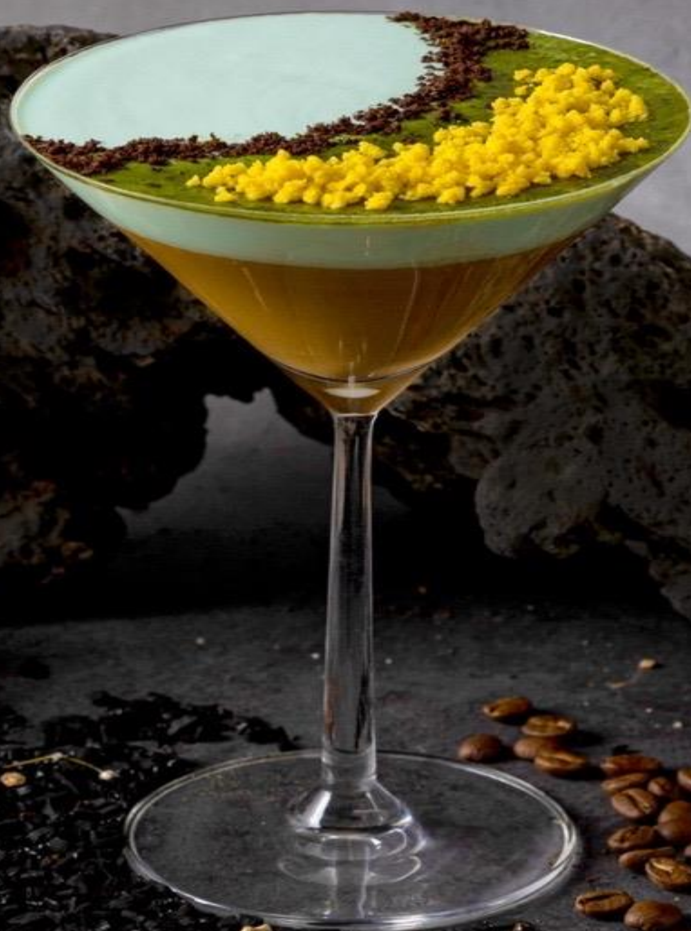
Dream Latte 梦幻拿铁