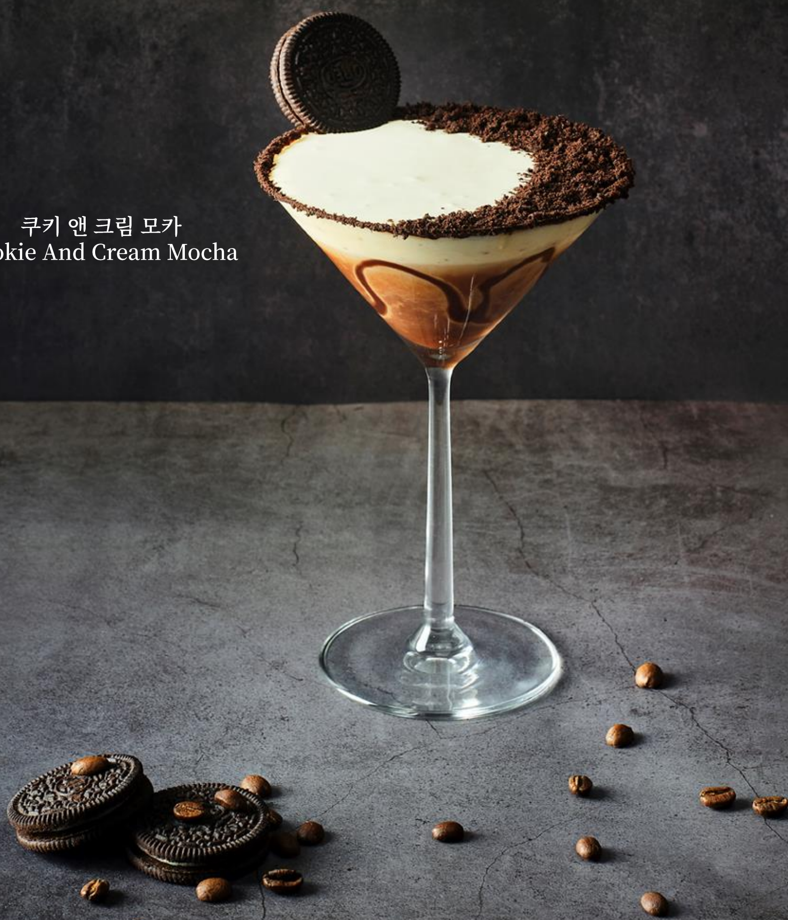
쿠키 앤 크림 모카 Cookie And Cream Mocha