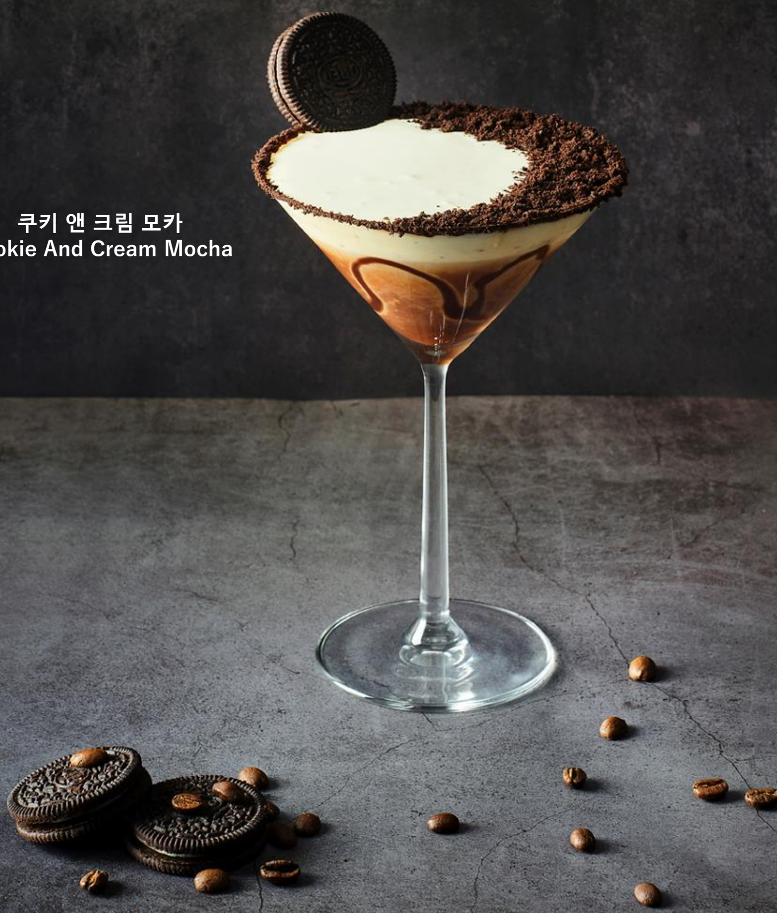
쿠키 앤 크림 모카 Cookie And Cream Mocha